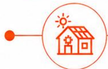
SISTEMAS SOLARES CASEIROS (SHS)