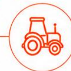
USOS PRODUTIVOS DE ENERGIA