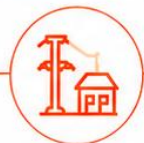
MINI-REDES E MESH-GRIDS