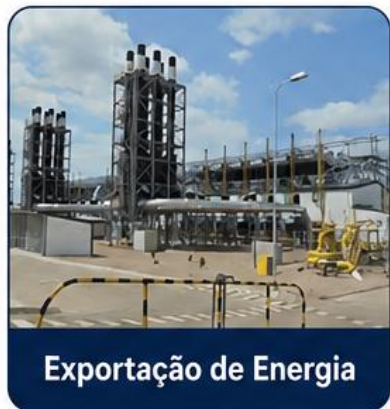
Exportação de Energia

Regular a Taxa de Acesso Universal (TAU), destinada ao financiamento da expansão do acesso à energia eléctrica em todo o território nacional.